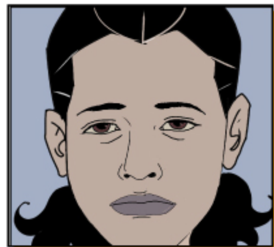
ริมฝีปากหรือผิวแห้งมีสีม่วงคล้ำ