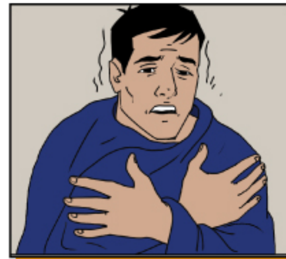
ตัวสั่นโดยไม่สามารถควบคุมได้