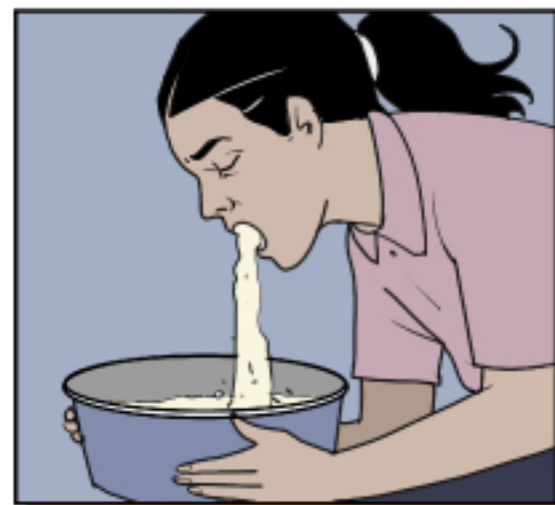
อาเจียนหรือท้องเสียอย่างรุนแรง

ไม่รู้สึกตัว สับสน (เช่น จำคนในครอบครัว หรือเพื่อนๆ ไม่ได้)