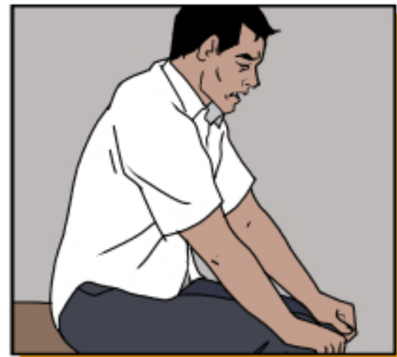
หายใจติดขัด

ไม่ต้องเข้ารับการรักษาที่สถานพยาบาล นอกจากว่าท่านจะมีอาการรุนแรง เช่น